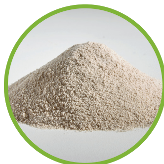
Plasma di sangue essiccato spruzzato