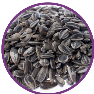
Semi di girasole