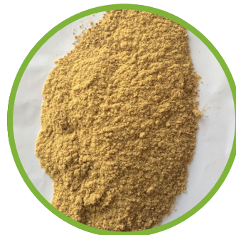
Proteine derivate dal processo della gelatina