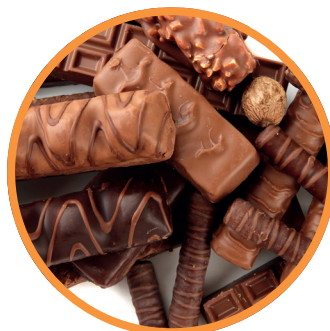
Barrette di cioccolato