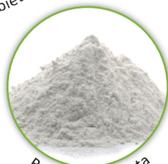
Proteina di patata