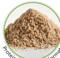
Proteine animali trasformate