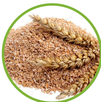
Crusca di frumento