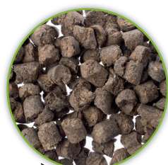
Trebbe di birra