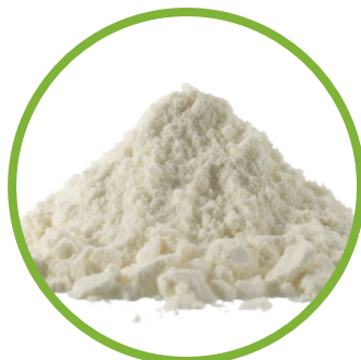
Latte scremato in polvere