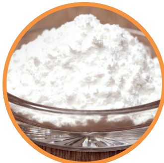
Additivi alimentari e per mangimi