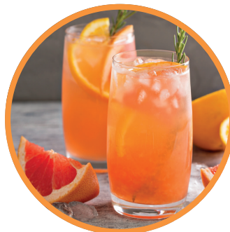
Succo di frutta