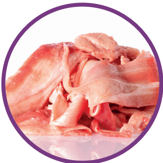
Cuoio e pelli