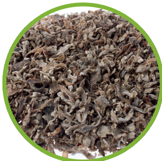
Polpa di barbabietola da zucchero