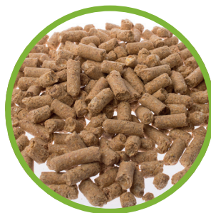
Pellet di glutine di mais