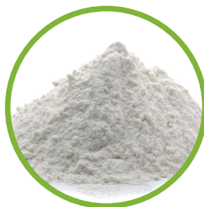
Proteina di patata