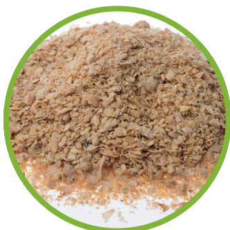
Farina di soia