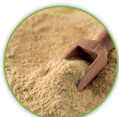
Lieviti di birra