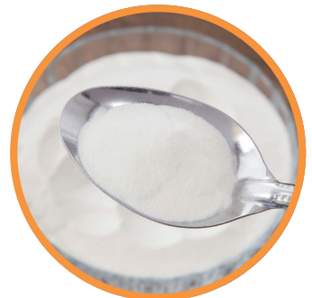
Idrolisato di collagene (peptide di collagene)