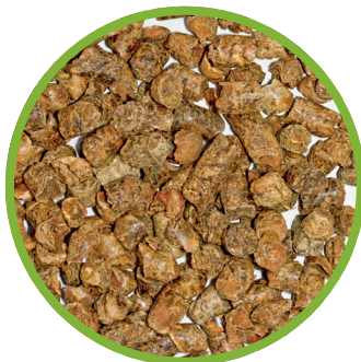
Pellet di pastazzo di agrumi essiccato