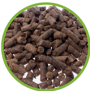
Pellet di trebbie essiccate di distilleria