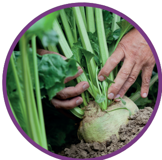
Barbabietola da zucchero