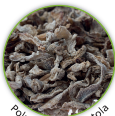
Polpe di barbabietola