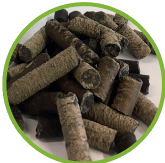
Granuli di biomassa microbica