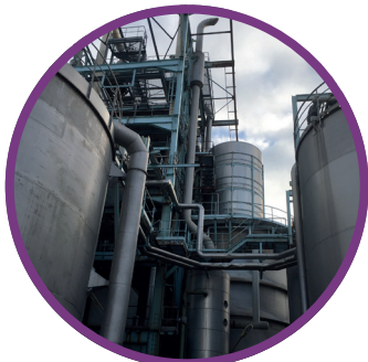
Microorganismi coltivati in un fermentatore industriale