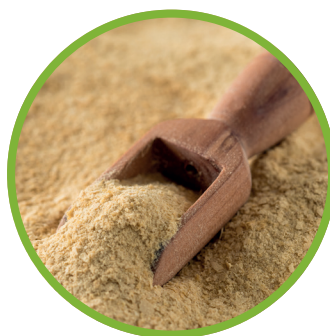
Lievito di birra