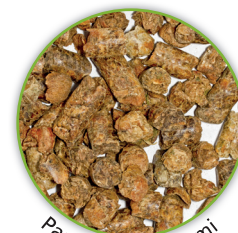
Pastazzo di agrumi