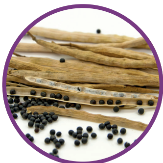
Semi di colza