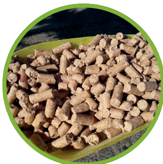
Ex prodotti alimentari trasformati