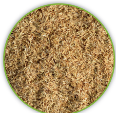
Pula di riso