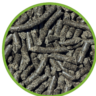
Pellet di farina di estrazione di girasole