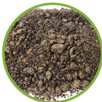
Farina di semi di colza