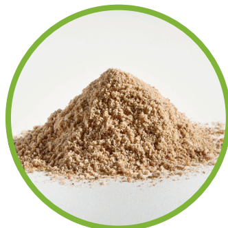
Proteine animali trasformate