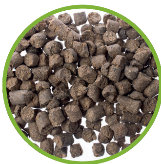
Trebbie di birra