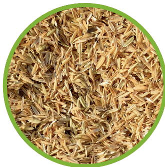
Pula di riso