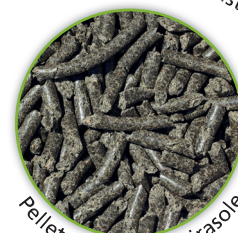
Pellet di farina di girasole